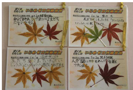
いじめをなくそう宣言 南小オリジナルカード作成