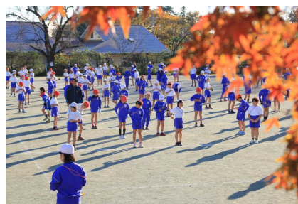
朝の運動短縄飛び