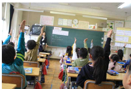
1年生校内人権教育 授業研究会