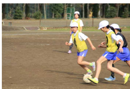
江南地区5年生サッカー大会