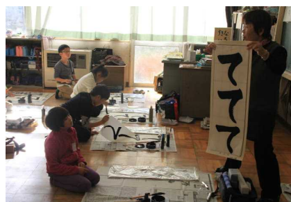
3年生書きぞめ練習