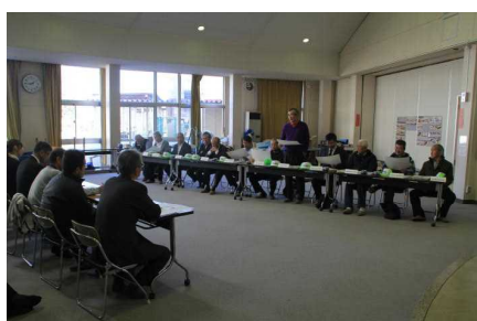
第三回南校区防災連絡協議会