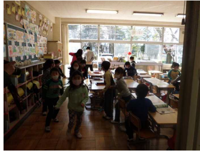
不審者対応避難訓練