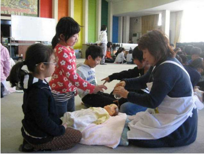
育児体験出前授業（2年生）